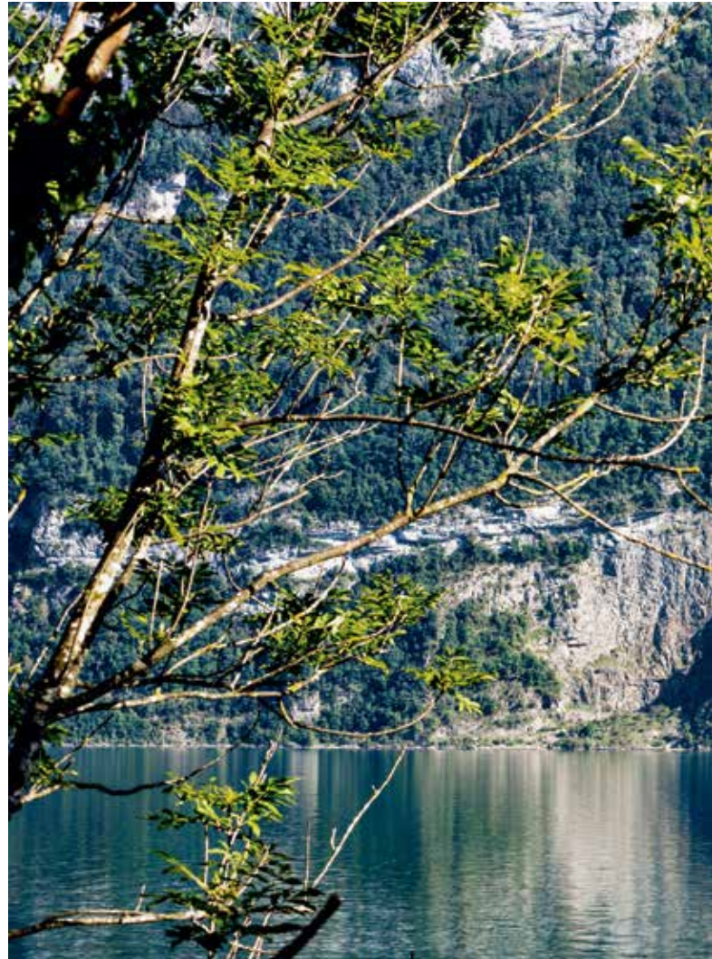
Site IFP n° 1613, Speer – Churfirsten – Alvier, dans le canton de St-Gall: «Paysage montagnard d'une beauté impressionnante, d'un grand intérêt floristique, géologique et touristique.»

Les inventaires fédéraux répertorient les joyaux du patrimoine culturel et naturel de la Suisse. Les atteintes à de tels objets sont