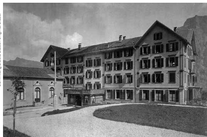
Das «Grand Hotel des Alpes» nach dem Wiederaufbau von 1886 Le «Grand Hôtel des Alpes» après la reconstruction de 1886