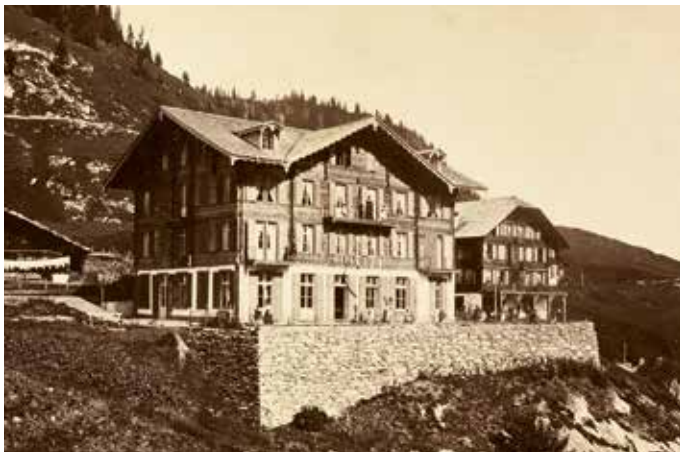
Die Hotels Silberhorn (rechts, 1858 eröffnet) und Mürren (links, 1871 hinzugefügt, mit Querfirst von 1876)