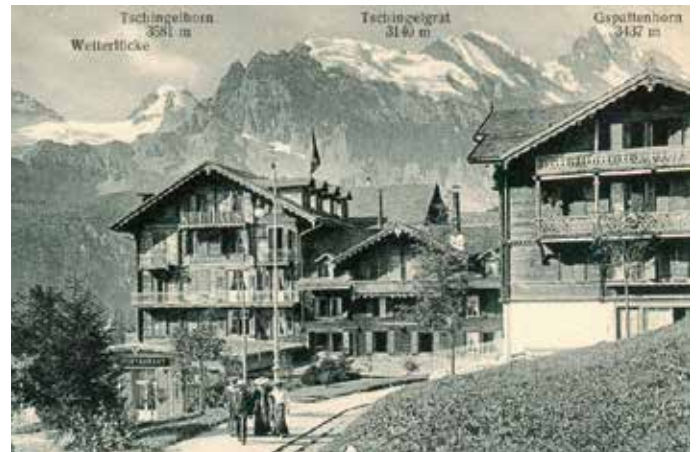
Seit 1894 wurden die Hotelgäste des massiv ausgebauten «Grand Hotel Mürren & Kurhaus» mit dem eigenen Rösslitram abgeholt.

Les Hôtels Silberhorn (à droite, ouvert en 1858) et Mürren (à gauche, ajouté en 1871, avec l'avancée perpendiculaire datant de 1876)