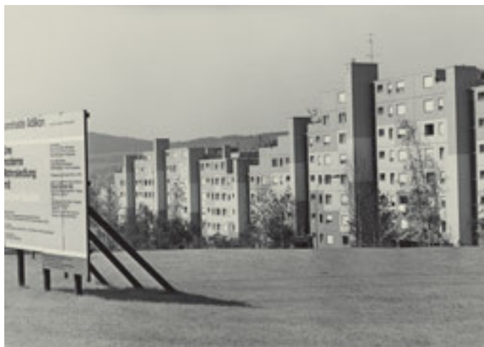
Gemeinde: Regensdorf Objekt: Wohnsiedlung Datum: Juni 1972

Commune: Dinhart Objet: Quartier de logements Date: Septembre 1974