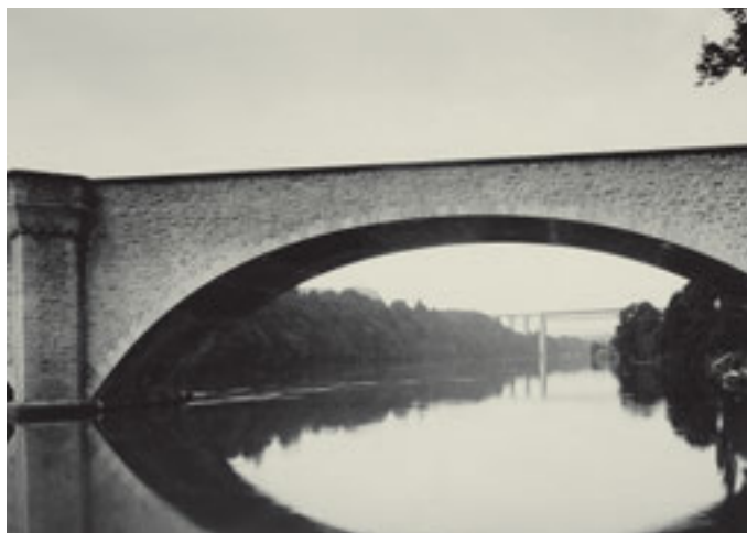
Gemeinde: Eglisau Objekt: Neue Rheinbrücke Datum: August 1933

Commune: Dinhart Objet: Local de gymnastique Date: Mars 1948