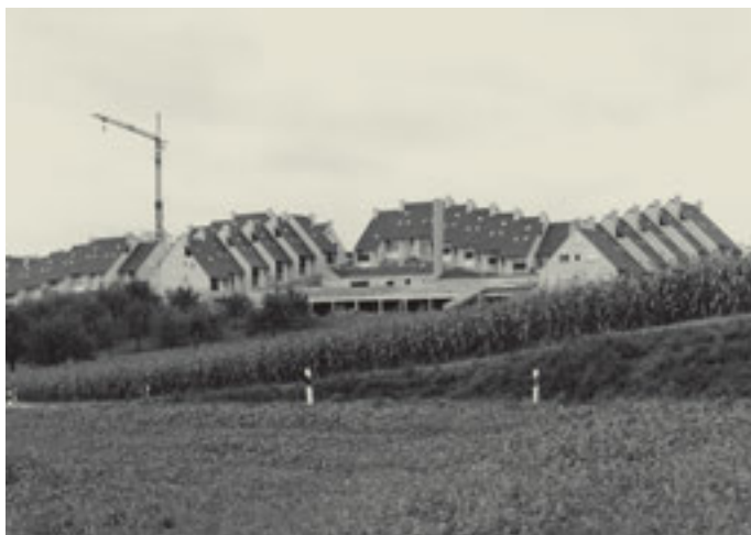
Gemeinde: Dinhart Objekt: Wohnsiedlung Datum: September 1974

Commune: Hirzel Objet: Bassin d'apprentissage de la natation Date: Janvier 1970