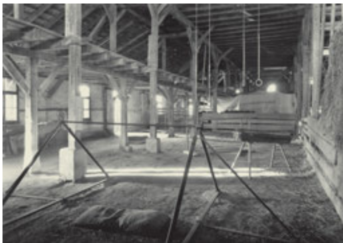
Gemeinde: Dinhart Objekt: Turnlokal Datum: März 1948

Commune: Dinhart Objet: Local de gymnastique Date: Mars 1948