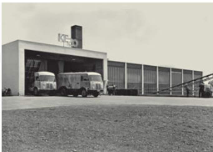
Gemeinde: Hinwil Objekt: Kehrlichtverbrennungsanlage Datum: Mai 1964

Commune: Eglisau Objet: Nouveau pont sur le Rhin Date: Août 1933