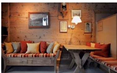
Chesa Sulai S-chanf, 2014

L'offre de locations s'enrichit de plusieurs objets: une maison en pierre, à Brusio (GR), entièrement rénovée en collaboration avec la conservation du patrimoine, une grange réaffectée à Beatenberg (BE) et la Blumenhalde, dans le village d'Uerikon (ZH), une maison à colombages du XVIII e siècle appartenant à la Ritterhaus-Vereinigung d'Uerikon. Dès le mois d'octobre, deux autres logements de vacances sont mis en location dans une maison engadinoise à Scuol (GR) et à partir du mois de décembre, deux autres objets à Niederwald (VS).