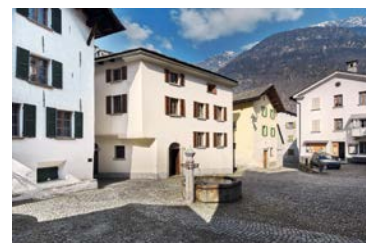
Ciäsa Picenoni Cief Bondo, 2015

Dès le mois de janvier, un séjour dans la Schindelhaus d'Oberterzen (SG) offre à des vacanciers la possibilité de découvrir comment faire rimer confort moderne avec préservation du patrimoine bâti. A partir du mois de mars, la Ciäsa Picenoni Cief accueille des touristes d'ici et d'ailleurs à Bondo (GR), village du val de Bregaglia qui vient de recevoir le Prix Wakker. Un partenariat de coopération conclu avec e-domizil, spécialiste de la location de vacances, permet à la fondation de disposer d'un système moderne de réservation fonctionnel dès le printemps.