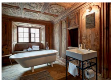
Türalihus Valendas, 2014

Dès le mois de juillet, la Bödeli-Huus, située à Bönigen, près d'Interlaken (BE), est mise en location. Cette ferme traditionnelle datant du XVIII e siècle est un exemple de construction polyvalente typique de la région. Le catalogue de locations s'étoffe dès le mois de novembre de la Chatzerüti Hof, située dans un hameau proche d'Hefenhofen (TG). La fondation enregistre pour la première fois plus de 10 000 nuitées en un an.