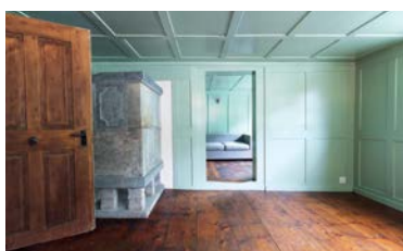
Stüssihofstatt Unterschächen, 2014

La fondation Vacances au cœur du patrimoine propose déjà douze logements de vacances dans dix maisons historiques. Le catalogue s'enrichit avec l'ajout du premier objet tessinois: la Casa Döbeli, située à Russo (TI). Fait remarquable, Vacances au cœur du patrimoine est nommée au Milestone 2010. Ce prix placé sous l'égide de la Fédération suisse du tourisme est décerné chaque année par htr-Hotelrevue et Hôtellerie suisse, avec le soutien du SECO. Il distingue des prestations exceptionnelles dans le cadre de l'innovation touristique en Suisse.