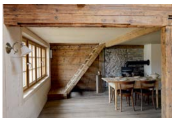
Bödeli-Huus Bönigen, 2013