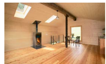
Scheune Beatenberg, 2009