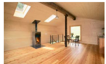
Scheune Beatenberg, 2009