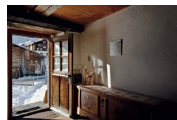
Unteres Turrahus Safiental, 2011

Seit Juli kann das Bödeli-Huus in Bönigen bei Interlaken BE, ein Beispiel eines regionaltypischen, im späten 18. Jahrhundert erstellten Mehrzweckbauernhauses, gemietet werden. Neu im Angebot ist ab November auch der Chatzerüti Hof in Hefenhofen TG, ein im Ursprungsbau auf das Jahr 1626 datiertes Bauernhaus, das idyllisch in einem barocken, denkmalgeschützten Bauerngarten liegt. Erstmals kann die Stiftung Ferien im Baudenkmal in einem Jahr mehr als 10000 Logiernächte verbuchen.