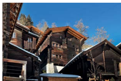
Gon Hüs Niederwald, 2009