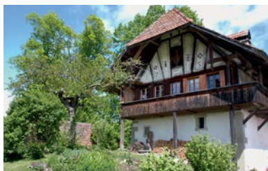
Ofenhausstöckli Zimmerwald, 2014

petite ferme du XVI e siècle, typique de la région, a été rénovée en collaboration avec le Service de la conservation du patrimoine.