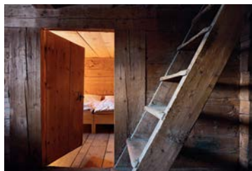
Nüw Hus Safiental, 2008

vorgelegt. Dank einem Beitrag aus dem Förderkredit für die Angebotserneuerung im Tourismus (Innotour) können die Vorarbeiten für das Projekt vorangetrieben werden.