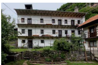
Casa Döbeli Russo, 2010

Ab Februar kann das Untere Turrahus im Safiental GR, ein Walserhaus der besonderen Art, gemietet werden. Im Juli kommen drei Wohnungen in den Fischerhäusern in Romanshorn TG dazu. Damit kann für diese lange Zeit leer stehenden Häuser eine gute Lösung realisiert werden. Ein Höhepunkt ist die Eröffnung des Hauses auf der Kreuzgasse in Boltigen BE. Das regionaltypische Kleinbauernhaus aus dem 16. Jahrhundert wurde in Zusammenarbeit mit der Denkmalpflege umfassend saniert.