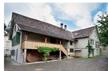
Fischerhäuser Romanshorn, 2011

Im Schindelhaus in Oberterzen SG kann ab Januar erlebt werden, wie harmonisch sich moderner Wohnkomfort mit historischer Bausubstanz verknüpfen lässt. Die Ciäsa Picenoni Cief empfängt ab März in Bondo GR, in der frisch gekürten Wakkerpreisgemeinde Bergell, Feriengäste aus nah und fern. Durch die Kooperation mit dem Ferienwohnungsspezialisten e-domizil steht der Stiftung ab dem Frühjahr eine neue, moderne Buchungstechnologie zur Verfügung.