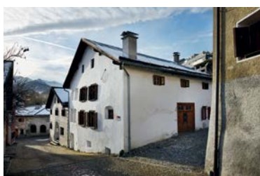
Engadinerhaus Scuol, 2009

Neu ins Angebot kommen ein Steinhaus in Brusio GR, das in Zusammenarbeit mit der Denkmalpflege vollständig renoviert werden konnte, eine umgenutzte Scheune in Beatenberg BE und das Haus Blumenhalde in Uerikon ZH, ein Riegelhaus aus dem 18. Jahrhundert, das der Ritterhaus-Vereinigung in Uerikon gehört. Weiter stehen in einem Engadinerhaus in Scuol GR ab Oktober zwei Ferienwohnungen zur Verfügung, und auch in Niederwald werden ab Dezember zwei zusätzliche Objekte vermietet.