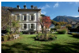
Weisse Villa Mitlödi, 2012-2014

L'édition 2/2004 de la revue Heimatschutz/Patrimoine présente le projet Vacances au cœur du patrimoine comme un projet concret pour la célébration, l'année suivante, du 100 e anniversaire de Patrimoine suisse. Une aide financière allouée pour l'encouragement de l'innovation touristique (Innotour) permet de progresser et de poser les premiers jalons du projet.