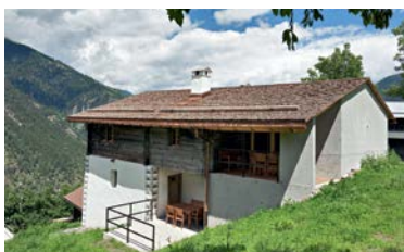
Belwalder-Gitsch Hüs Grenchols, 2014