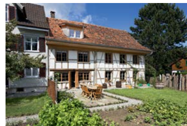
Chatzerüti Hof Hefenhofen, 2014