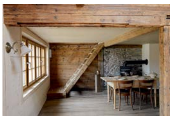
Bödeli-Huus Bönigen, 2013