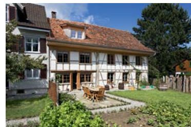
Chatzerüti Hof Hefenhofen, 2014