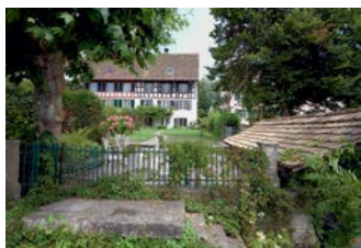
Haus Blumenhalde Uerikon, 2009

fiental GR wurde von der Stiftung Walserhaus Safiental gekauft, sorgfältig renoviert und wird nun über die Stiftung Ferien im Baudenkmal vermietet. Im Dezember kann das dritte Objekt in die Angebotspalette aufgenommen werden. Dank der Initiative einer Privatperson wird das Gon Hüs in Niederwald VS aus dem Jahre 1558 nun wieder bewohnt, nachdem es 200 Jahre lang teilweise leer stand und sich in kritischem Zustand befand.