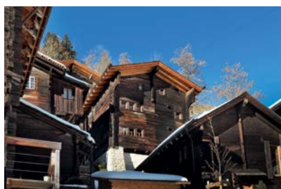
Gon Hüs Niederwald, 2009