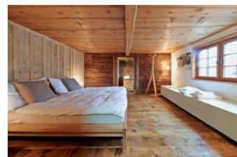
Schindelhaus Oberterzen, 2015

Magnifique exemple de maison engadinoise du XIV e siècle dont l'authenticité a pu être préservée, la Chesa Sulai, située au cœur du village de S-chanf (GR), complète dès le mois de janvier l'offre de locations. Les travaux de rénovation de la Stüssihofstatt, à Unterschächen (UR), une maison en bois de deux étages datant de 1450, se terminent en juin. Le chalet Ofenhausstöckli, de Zimmerwald (BE), et la Belwalder-Gitsch Hüs, à Grenchols (VS), peuvent accueillir des vacanciers dès le mois de septembre. La Türalihus, de Valendas (GR), qui reçoit le lièvre de bronze 2014 décerné par la revue Hochparterre , est inaugurée en septembre. En octobre, un ancien grenier à blé (Spycher), situé à Niederwald (VS), est intégré au catalogue de locations.