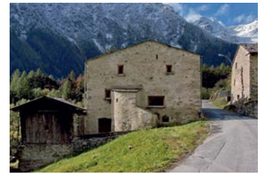
Steinhaus Brusio, 2009