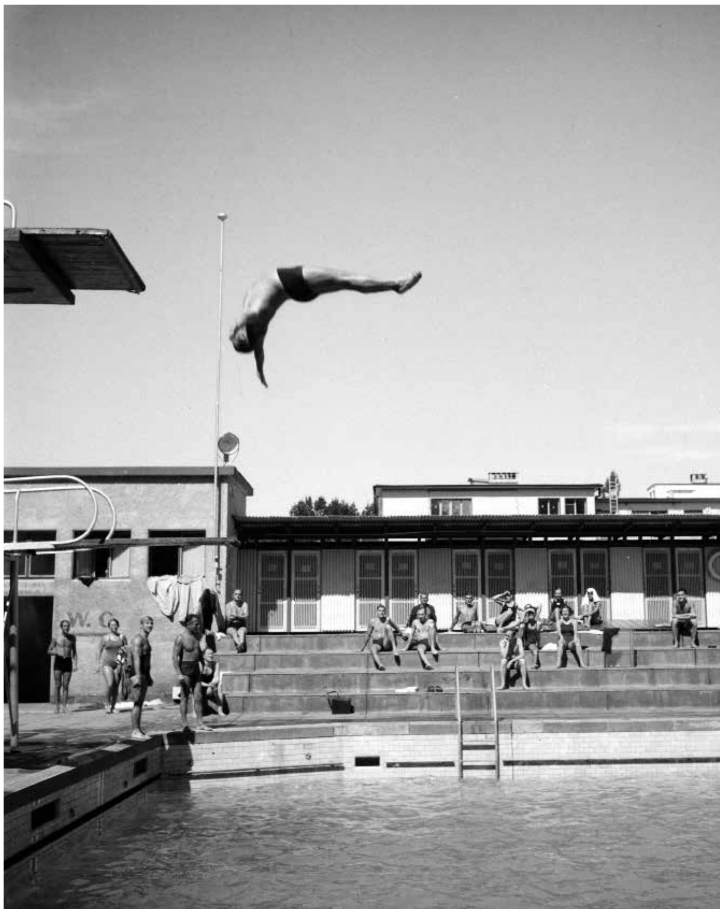
Plongeur de haut-vol à la piscine Ka-We-De vers 1945 Turmspringer in der Ka-We-De um 1945