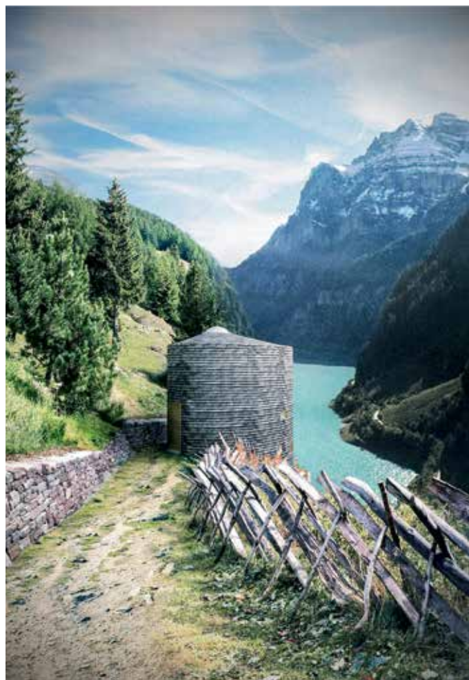
Hochschule Luzern/Marija Simic

Einnisten (Bild oben): Markus Busslinger integriert einen neuen Mehrzweckraum in ein bestehendes Gebäude. Dabei wird sowohl hinsichtlich des Materials als auch der Konstruktion auf den Bestand eingegangen.