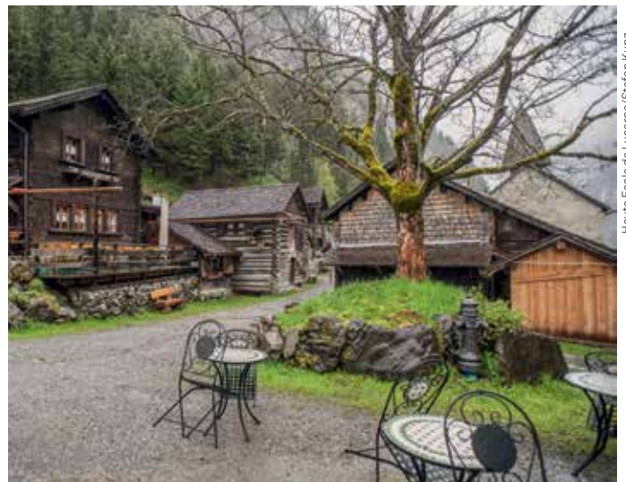
Haute Ecole de Lucerne/Stefan Kunz

Vue depuis la place du village, avec le restaurant à gauche et l'église en arrière-plan