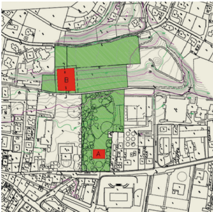
Extrait du plan cadastral présentant la superficie actuelle du parc de la villa Argentina de Mendrisio (en vert). A: la villa Argentina, B: le nouveau projet de construction

Autant d'excellentes raisons de présenter dans le cadre de la campagne «Année du jardin 2016 – espace de rencontres» trois parcs historiques tessinois dont l'importance est primordiale pour la population en raison de leur situation centrale, mais qui sont menacés car exposés à une très forte pression urbanistique: le 4 juillet 2016, le parc Balli de Locarno, le parc de la villa dei Cedri de Bellinzona et le parc de la villa Argentina de Mendrisio seront au