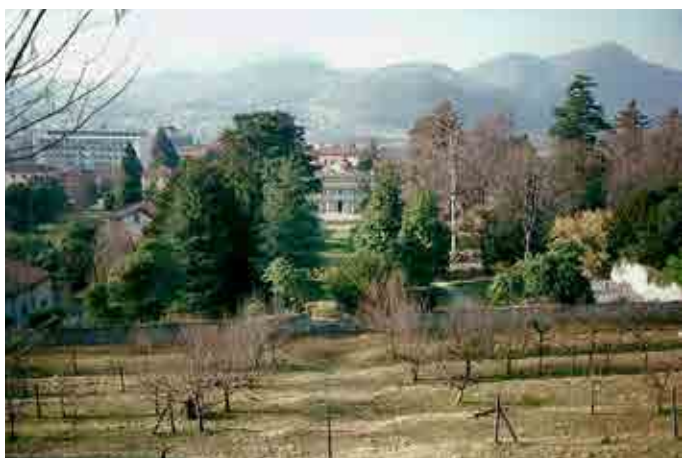
Der Park der Villa Argentina in Mendrisio 1993