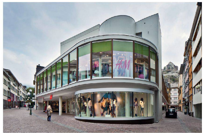
G. Bally, Keystone

Sions reiches baukulturelles Erbe der Moderne steht der Altstadt in nichts nach. Bild: Galeries du Midi de Sion