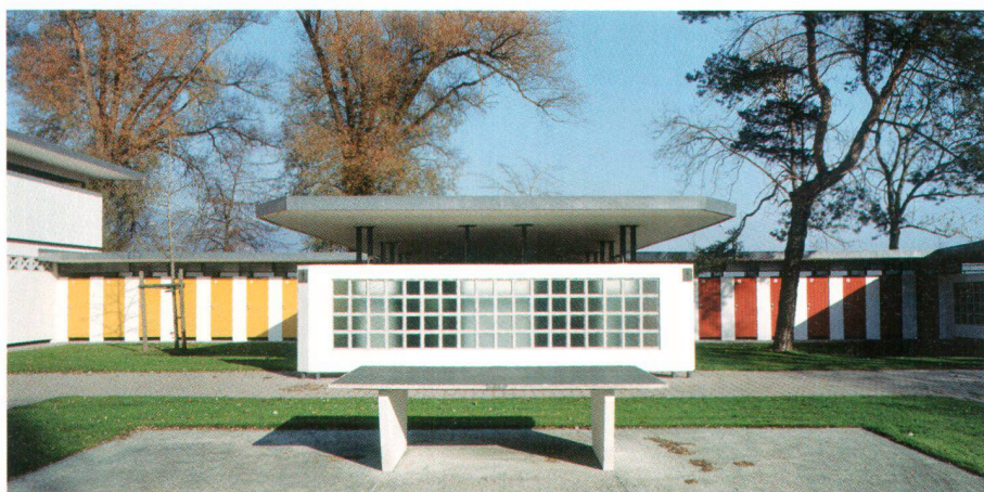
Das Grencher Schwimmbad von 1956 (Beda Hefti) wurde ab 1999 bis heute schrittweise saniert. Es ist ein Beispiel für den vernünftigen Umgang der diesjährigen Wakkerpreisgemeinde mit Bauten der 50er-Jahre. Die Anlage strahlt noch immer den Charme ihrer Zeit aus, genügt aber auch den heutigen Ansprüchen an ein Freibad