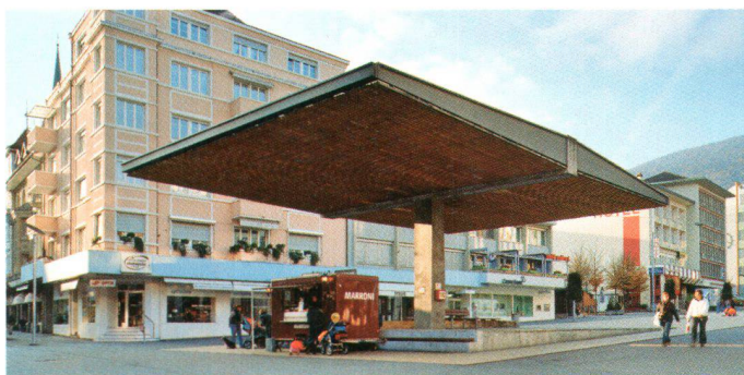
La place du Marché (Marktplatz) avec son toit très marquant (Bart & Buchhofer, Bienne 1999) sert désormais de lieu d'identification au cœur de la zone piétonne du centre

La revalorisation de l'espace public a visiblement débuté avec la remarquable transformation de la place du Marché (en 1999). Avec son toit marquant et sa fontaine caractéristique, elle est devenue le nouveau point d'identification de la ville. Depuis l'ouverture de l'autoroute en 2002, le centre de Granges ne subit plus le trafic de transit et les mesures d'accompagnement prévues de longue date ont pu être réalisées sans délai. L'aspect des rues a été retravaillé et un centre accueillant créé.