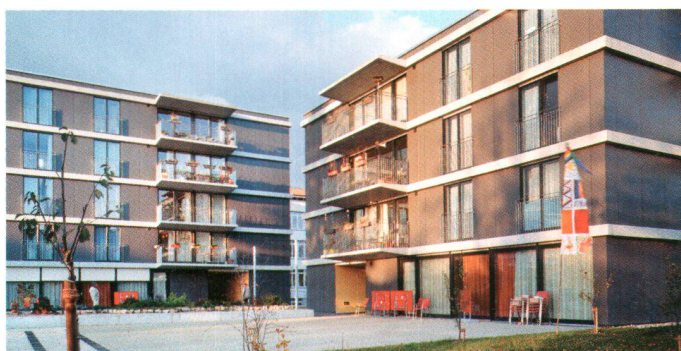
Construit en 2005-2007 (ARGE Bienne 97), le home avec foyer de jour pour personnes handicapées «Rodania» présente une architecture moderne empreinte de calme