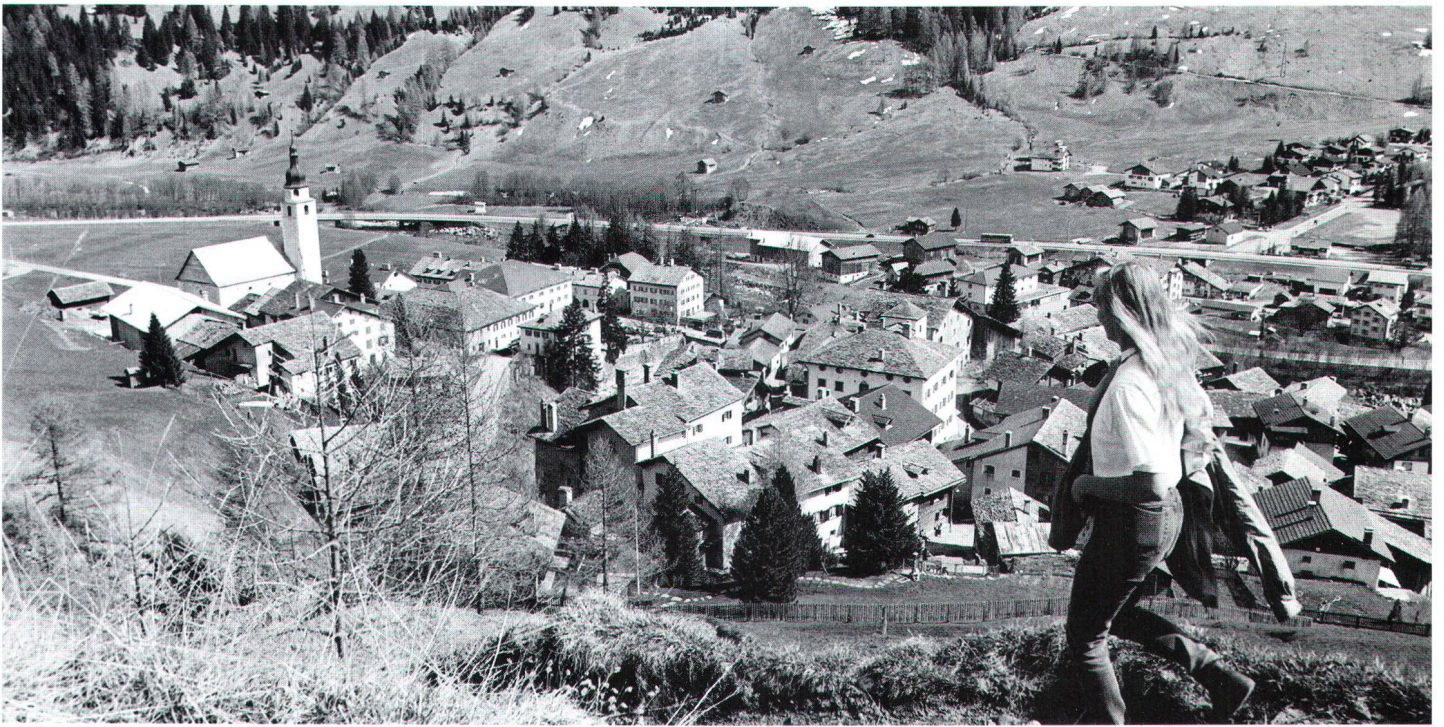
Der Dorfkern besteht aus zwei einander gegenüberliegenden Geländeterrassen, zwischen die der Sustenbach fliesst. Le centre du village comprend deux collines en terrasses qui se font face, et entre lesquelles coule le ruisseau de Susten.