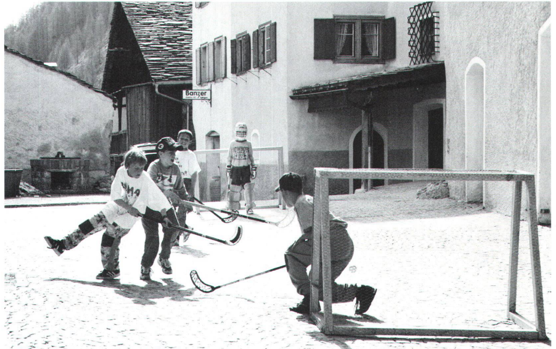
Der lauschige Ortskern ist offensichtlich auch ein Tummelplatz für die sportbegeisterte Dorfjugend.

Insgesamt stehen im Dorf 1150 Gastbetten zur Verfügung, wovon 700 in der Parahotellerie. Die Anzahl Logiernächte ist von 10 000 im Jahre 1960 auf 83 300 im Jahre 1993 gestiegen. Im Gegensatz zu andern Bündner Gemeinden hat Splügen von allem Anfang an auf einen massvollen Familientourismus gesetzt. Dadurch blieb das Dorf weitgehend intakt. Hier finden die Gäste im Sommer ein attraktives Netz an Wanderwegen und Hochgebirgsrouten, einen historischen Saumpfad mit Maultier-Trekking sowie gute Möglichkeiten zur Wildbeobachtung und zu Wildwasserfahrten. Den Wintertouristen – die meisten kommen aus dem Tessin und Oberitalien – bietet Splügen am Fusse des Piz Tambo ein gut erschlossenes Skigebiet und in der Talsohle Langlaufloipen und gepfadete Spazierwege. Anfangs Mai 1995 ist zudem mit dem Bau einer Gondelbahn von Splügen auf die Tanatzhöhe und eines Bergrestaurants begonnen worden. Sie sollen dem Dorf 40 neue Arbeitsplätze verschaffen. Die Anla-