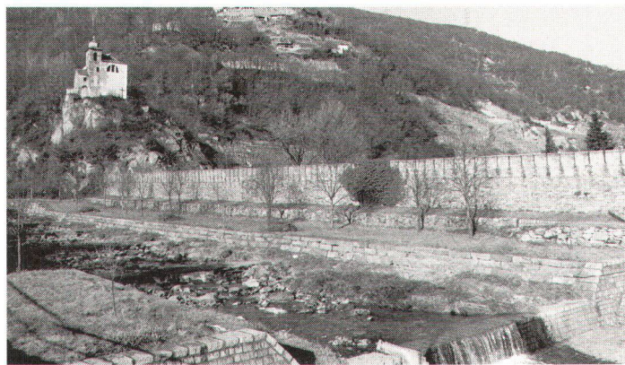
Die aus dem 19. Jahrhundert stammende Wehrmauer mit der Bergkirche San Bernardo im Hintergrund. Les remparts du XIXe siècle, avec l'église de montagne San Bernardo à l'arrière-plan.

Das ursprüngliche Bauwerk aus dem 14. und 15. Jahrhundert, 1427 mit Fresken bemalt, wurde gegen Westen um die Mitte des 15. Jahrhunderts erweitert. Das zusätzliche Segment des Schiffes wurde mit einem Gemälde-Zyklus der Seregneser dekoriert. Die Autoren seien Christoph und Niccolao von Seregno, wohnhaft in Lugano und aktiv zwischen 1455 und 1500. Sie zeigen auf der Südwand verschiedene Szenen aus dem Leben von Heiligen, an der Nordwand eine Darstellung des Abendmahles. Unverwechselbarer stilistischer Zug der Seregneser ist ihre Vorliebe für die dekorative Ausstattung wie auch die archaischen Gebärden und die Drapierung mit noch gotisierendem Geschmack. Der Aktionsradius dieses Ateliers reichte vom Mendrisiotto bis zum Medelser Tal, Disentis und Brigels, von Locarno bis nach Mesolcina. Ihr Werk konzentrierte sich jedoch vornehmlich auf Bellinzona, entwickelte sich im 3. Quartal des 15. Jahrhunderts längs der Transitwege, aber auch an heute ungebräuchlichen Strassen und Siedlungen. Ausser diesen Bildern beinhaltet die Kirche aber auch Fresken des 17. Jahrhunderts (Kreuzigung, die Evangelisten und Szenen aus dem Leben San Bernards). Tritt man aus der Kirche, findet man auf der Aussenwand noch andere Jahrhunderte. Die Vorderseite der Vorhalle, im 16. Jahrhundert hinzugefügt, ist mit Bildern von 1582 geschmückt worden. Die Ikonographie ist interessant, da sie an