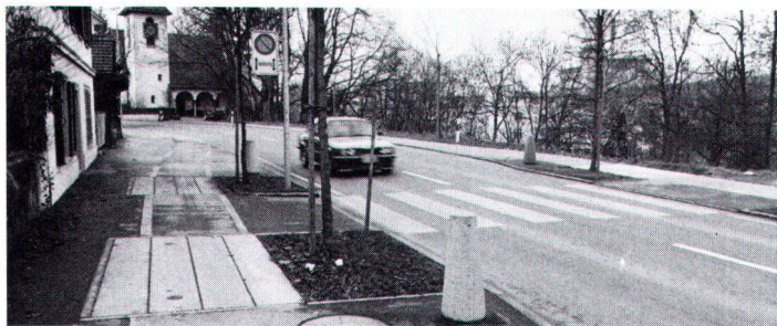
Redimensionierte Sinsstrasse mit Verengung bei Fussgängerstreifen.

In dieser Alltagsarbeit wird die Gemeinde Cham durch den Wakker-Preis bestärkt, zugleich aber auch ermahnt, den hohen Zielen der Ortsplanung jederzeit gerecht zu werden.