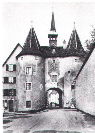
La porte de France. Die «Porte de France» (Bild Stähli).

De ce Porrentruy, capitale d'un Etat ecclésiastique, il reste malgré la Révolution et plus d'un siècle de libéralisme musclé, de nombreux signes extérieurs : ensemble du couvent / collège des Jésuites institué comme bastion de la Contre-Réforme, couvent des Ursulines; église paroissiale gothique de Saint-Pierre, église de Saint-Germain, étrangement située hors des murs depuis le moyen-âge, temple réformé