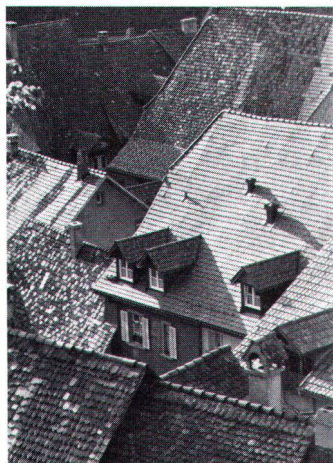
Sämtliche Freileitungen wurden verkabelt...

Neben diesen grundsätzlichen Vorschriften beschreibt die seit 1978 rechtskräftige Bauordnung sehr detaillierte