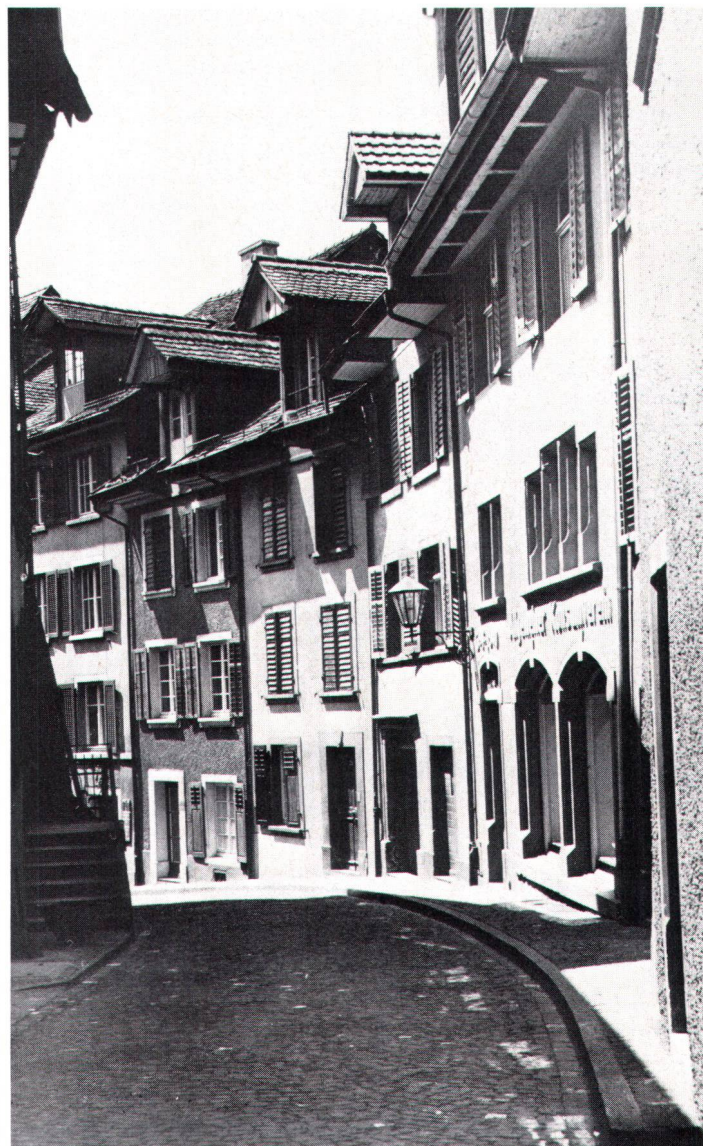
Altstadtrromantik ohne perfektionistische Allüren in Laufenburg

Mit einer Wiederholung des 1959 uraufgeführten Tonlichtspieles «Son et lumière» hat Laufenburg AG am 16. Juni die Übernahme des Wakker-Preises 1985 des Schweizer Heimatschutzes (SHS) gefeiert. Welche planerischen Massnahmen nötig waren, um das mittelalterliche Städtchen aber soweit zu bringen, zeigt der folgende Beitrag.