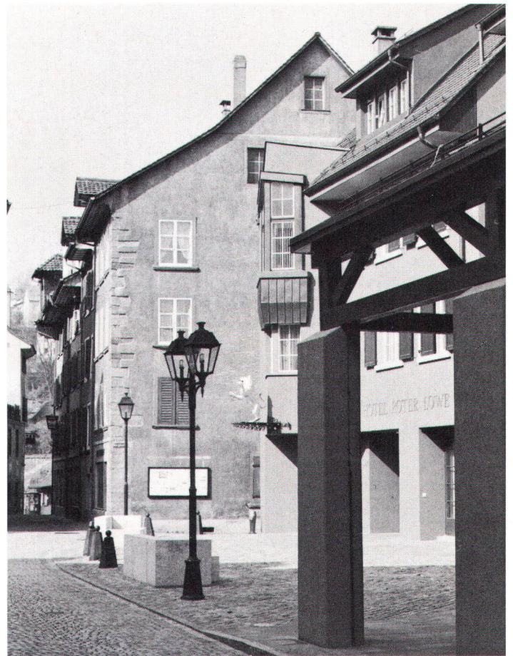
Tragbarer Versuch, neue Architektur mit der bestehenden zu verbinden

– der Wohnlichkeit der Altstadtwohnungen ( Besonnung,