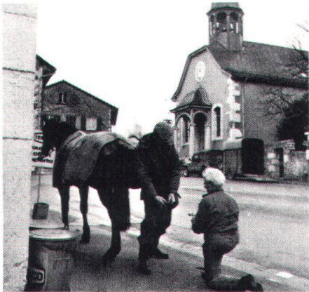
Der Hufschmied ist in Dardagny nicht der einzige Handwerker, der sich bis in unsere Tage erhalten konnte.

wicklung des Schlosses. Jede der beiden Festungen war Sitz einer Herrschaft und teilte die Gemeinde in zwei Hälften, die noch heute erkennbar sind. Zwischen dem Süd- und dem Nordteil eingebettet sind die Kirche und das Schloss.